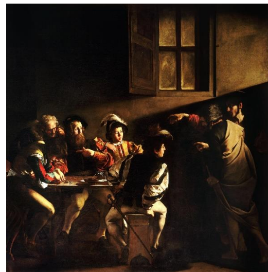
Appel de Matthieu, Caravage

Luc 6,12. Et c'est en ces jours, Jésus sortit vers la montagne pour prier. Il passa toute la nuit à prier Dieu. 13. Quand vint le matin, il convoqua ses disciples. Parmi eux il en choisit douze, qu'il nomme apôtres, « envoyés » : 14. Simon, qu'il nomme aussi Pierre, et André, son frère, Jacques et Jean, Philippe et Barthélemy, 15. Matthieu et Thomas, Jacques fils d'Alphée et Simon, appelé le Zélote, 16. Et Judas fils de Jacques, et Judas Iscarioth, qui devint un traître.